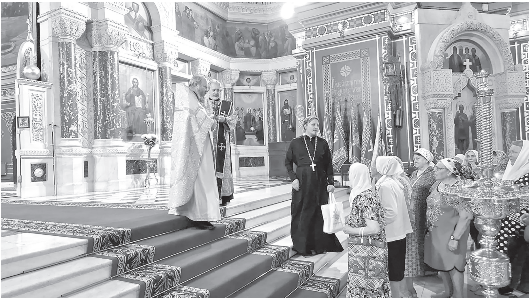
На службе в Свято-Вознесенском храме в Новочеркасске

Следующим пунктом нашего назначения была Москва, Главный храм Вооруженных сил России в подмосковном парке «Патриот». Рассказывать про него в газете — дело пустое, нужно самому приехать и все уви-