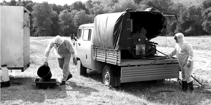
Проводятся противоэпидемические мероприятия

В высокогорье Малокарачаевского и Карачаевского районов Карачаево-Черкесии расположена часть Северо-Кавказского природного очага чумы. Это труднодоступные горные участки, где обитают популяции сусликов, являющихся резервуаром чумной инфекции с незапамятных времен. Инфекцию внутрипопуляционной переносят блохи. Специалисты Кабардино-Балкарской противочумной станции много лет ведут наблюдение за природным очагом. В июле-августе, когда подрастает молодняк сусликов, эпидемиологи прово-